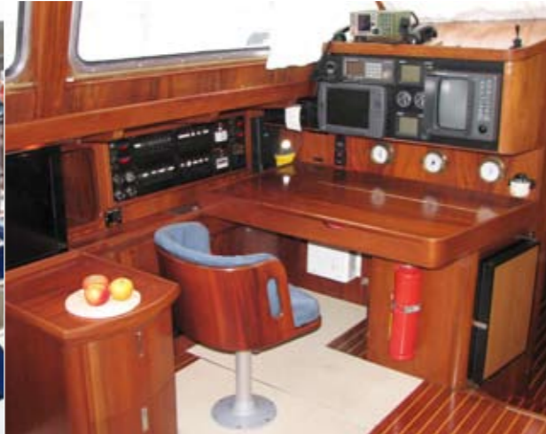
Der freundliche Navigationsplatz für den Skipper.