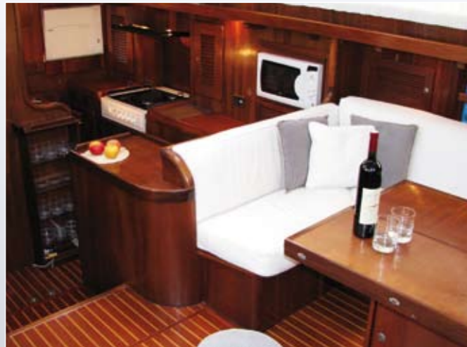
Blick vom Salon aus über die Bar in die Küche.