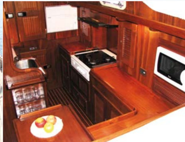
Die gut ausgestattete Küche mit ihren großen Kühlschränken.