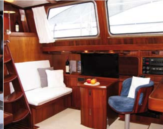
Das kleine, kuschelige Eck, um dem Skipper über die Schulter zu sehen.