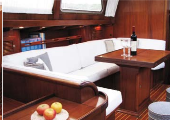
Der einladende Salon bietet Platz für die ganze Crew.