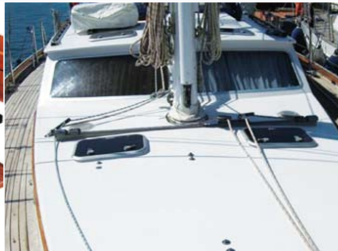
Das Vorschiff bietet viel Platz zum Sonnen und Entspannen.