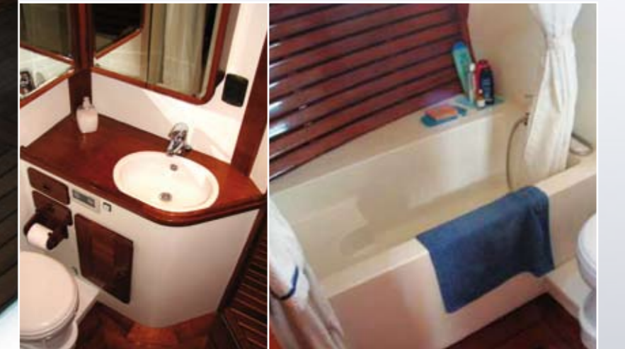
Das geräumige Bad der Achterkabine.

Aktuelle Termine und Preise finden Sie im Stuis-Törns-Katalog