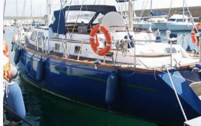
Die „SOPHIA“ an ihrem Liegeplatz.