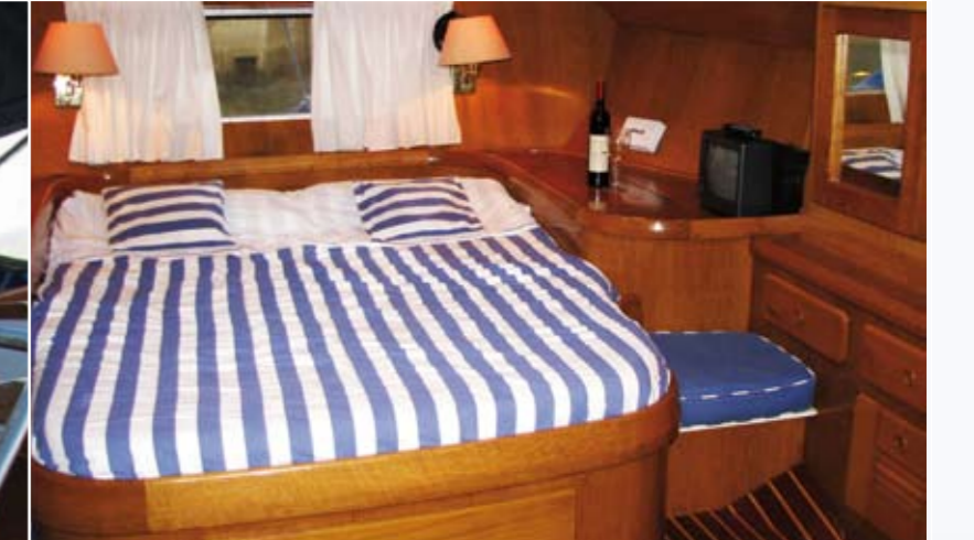
Die große Achterkabine mit ihrem persönlichen Flair und viel Stauraum. Diese Kabine wird gegen Aufpreis gerne für Sie reserviert.