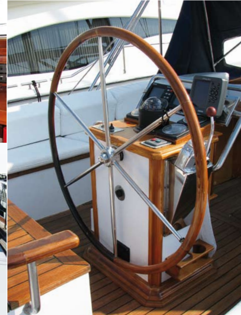
Der Steuerstand aus wunderschönem Holz, verbunden mit moderner Technik, lässt jedes Seglerherz höher schlagen.