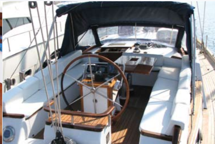
Das großzügige, Wind und Spritzwasser geschützte Cockpit.